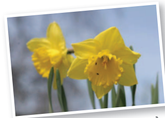
Gleðiligar páskir :)

* Fyrivarni verður tikið fyri broytingum í skránni