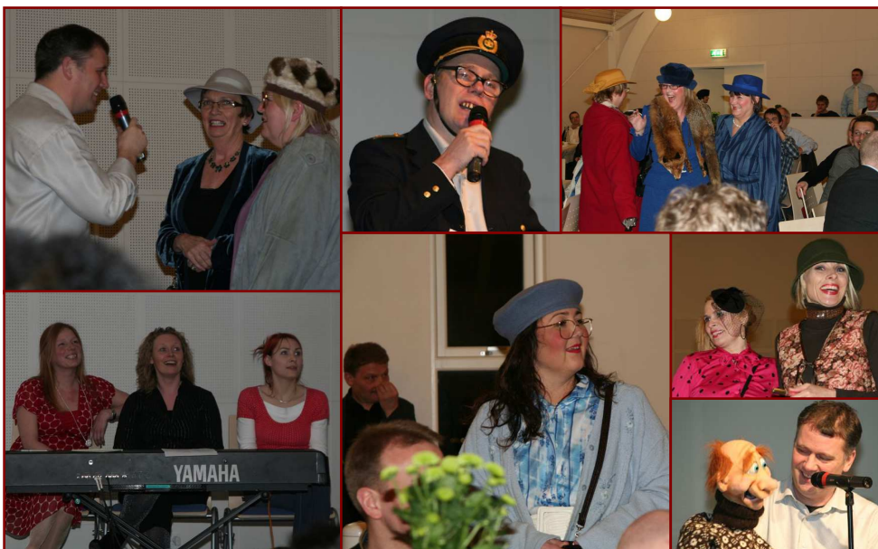
Myndir frá ársveitsluni

Veitslan var hugnalig við nógvum ymskum á skránni sum t.d. skemti, sangkapping, spurnarkapping og mótaframsýning. Eisini var góður matur at fáa. Umleið 180 fólk vóru til ársveitsluna.