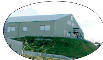
Á Brekku 3

Undirvísing og bøn týskvøld kl. 20.00 (Triðja hvørt týskvøld eru húsbólkar) Bønarløta fyri ung mikukvøld kl. 18.00 Ungdómsmøti fríggjakkvøld kl. 20.30