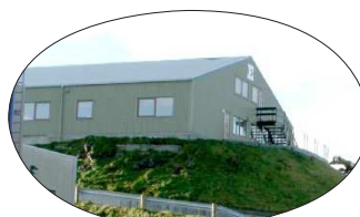
Á Brekku 3