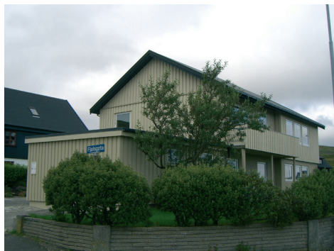
Samkoman Marknagil í Fjalsgøtu 2 í Havn

Samkoman byrjaði sítt virksemi í vesturbýnum í oktober 2004 og hevur m.a. hildið til í kantinuni á Skúlaheiminum við Marknagil. Á heimasíðuni www.marknagil.fo stendur, at fyrimyndin hjá samkomuni er ein bíbilsk, nýtestamentlig og evangelisk samkoma.